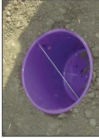
Postavljanje feromonskih klopki na novom repištu

Po potrebi unose se praškasti ili granulirani insekticidi u lovne kanale, posle većih padavina ili svakih 7-10 dana