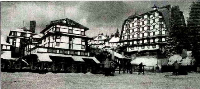
УЗДАНИЦЕ Хотели „Гранд“ и „Анђела“

СА ЦЕНАМА ЗА ТУРИСТЕ РАЗЛИЧИТОГ ИМОВИНСКОГ СТАЊА, СРПСКА ПЛАНИНСКА ЛЕПОТИЦА СПРЕМНО ДОЧЕКАЛА ЗИМУ